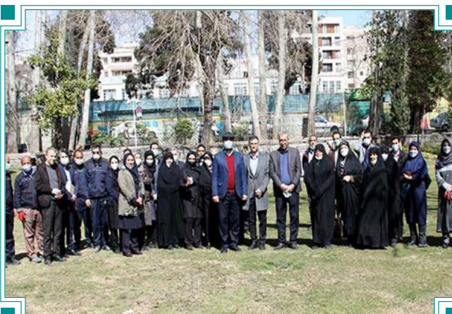
برگزاری مراسم روز درختکاری در دانشگاه الزهرا(س)