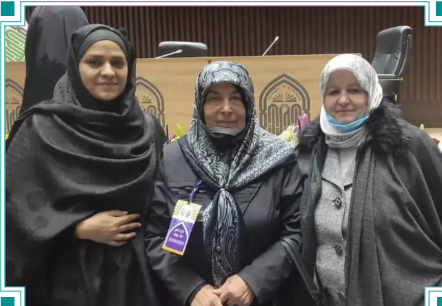
موفقیت دانش‌آموخته دانشگاه الزهرا در جشنواره بین‌المللی کوثر عصمت