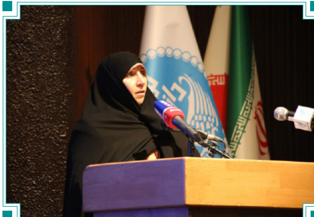
حضور و سخنرانی عضو هیئت علمی پژوهشکده زنان در آئین گرامیداشت روز زن در دانشگاه تهران