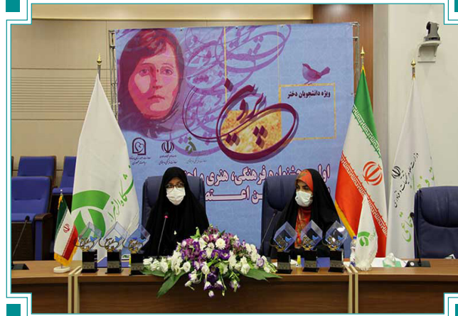
برگزاری آیین اختتامیه اولین جشنواره فرهنگی، هنری و اجتماعی پروین اعتصامی