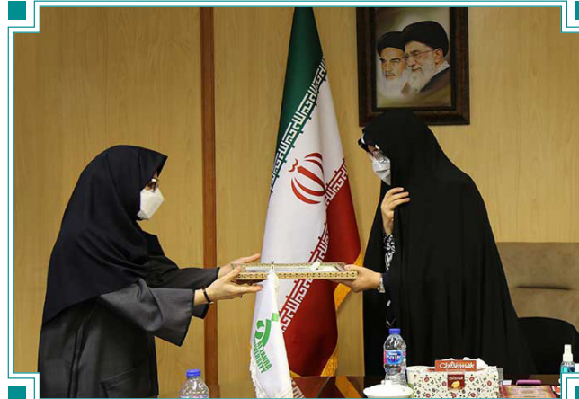
تقدیر هیأت رئیسه دانشگاه الزهرا (س) از استاد سرآمد آموزش عالی کشور