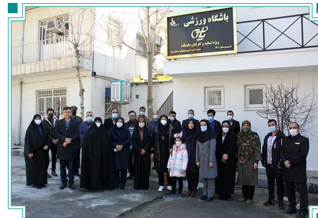
افتتاح باشگاه ورزشی یاس ویژه اعضای هیئت‌علمی و کارکنان