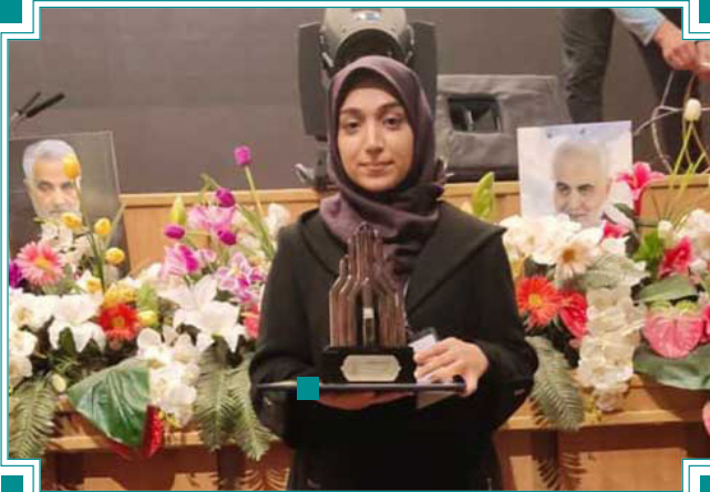
افتخارآفرینی دانشجوی گروه پژوهش هنر در سومین رویداد ملی تولید محتوای دیجیتال بسیج به مناسبت هفته بسیج