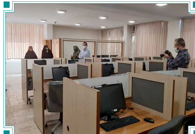
رونمایی از سالن آزمون بین‌المللی دانشگاه الزهرا