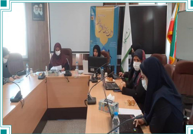
دومین همایش ملی چالش‌های خانواده ایرانی: زنان و خانواده در دوران کرونا