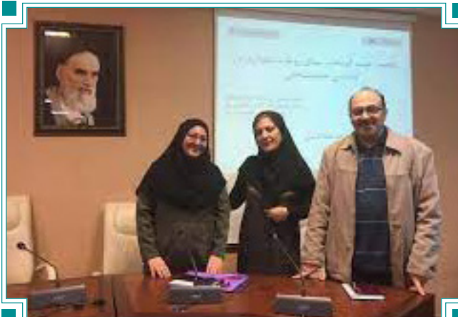
انتخاب پایان‌نامه دانش‌آموخته زبان‌شناسی دانشگاه الزهرا (س) در سومین دوره جایزه دکتر محمد مقدم