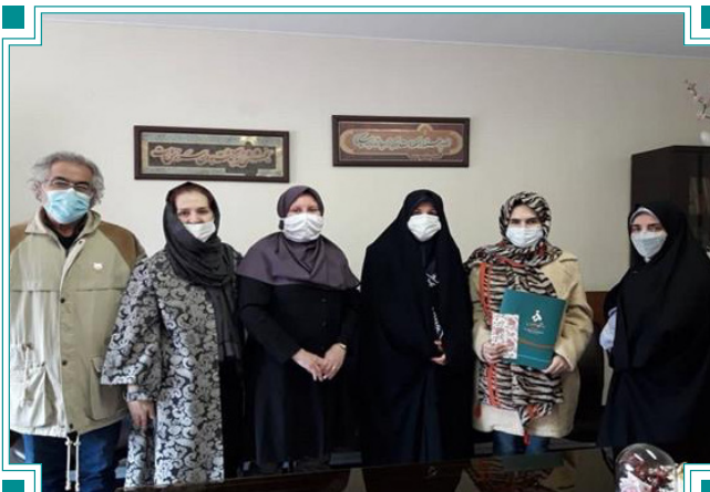
تقدیر از دانشجویان نمونه دانشگاهی دانشگاه الزهرا(س)