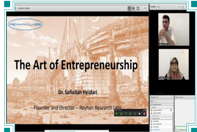
برگزاری وبینار «هنر کارآفرینی در حوزه دیجیتال» با سخنرانی نخبه ایرانی مقیم استرالیا