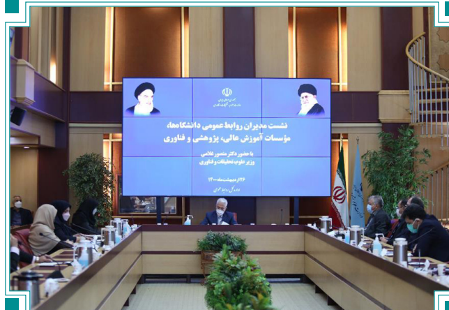
نشست مدیران روابط عمومی دانشگاه‌ها، مؤسسات آموزشی و فناوری