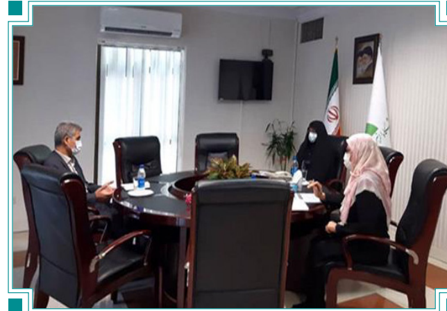
ملاقات رییس دانشگاه با رایزن علمی ایران در ترکیه