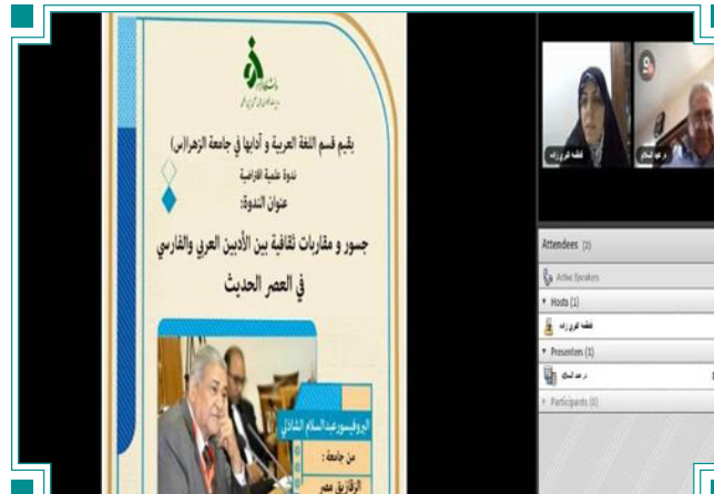
حضور مجازی استاد مصری در نشست علمی گروه زبان و ادبیات عربی