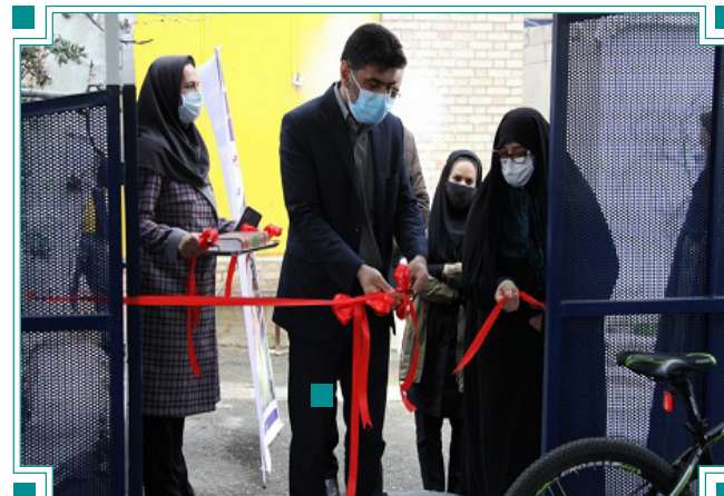
افتتاح خانه دارت و آشیانه دوچرخه سواری دانشگاه الزهرا(س)