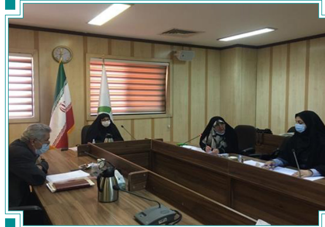
نشست مجازی ریاست دانشگاه الزهرا با ریاست دانشگاه کوفه - عراق