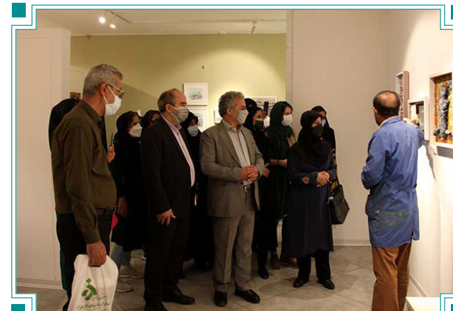
افتتاح نمایشگاه دومین جشنواره مدیریت پسماند با ۱۳۷ اثر