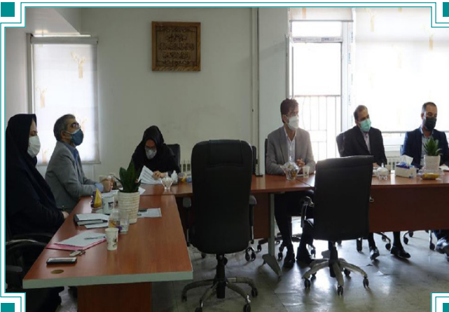
سیزدهمین جلسه کمیته پذیرش و ارزیابی واحدهای فناور مرکز رشد دانشگاه الزهرا (س)