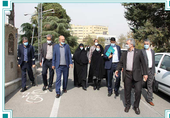
بازدید اعضای کمیسیون آموزش و تحقیقات مجلس از دانشگاه الزهرا (س)