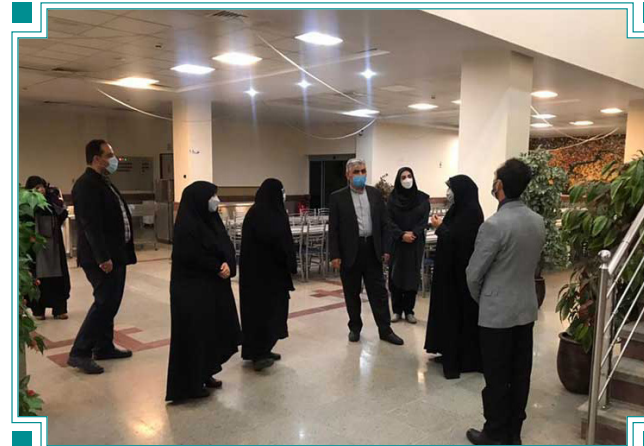
بازدید رئیس صندوق رفاه دانشجویان وزارت علوم از بخش‌های دانشجویی دانشگاه الزهرا (س)